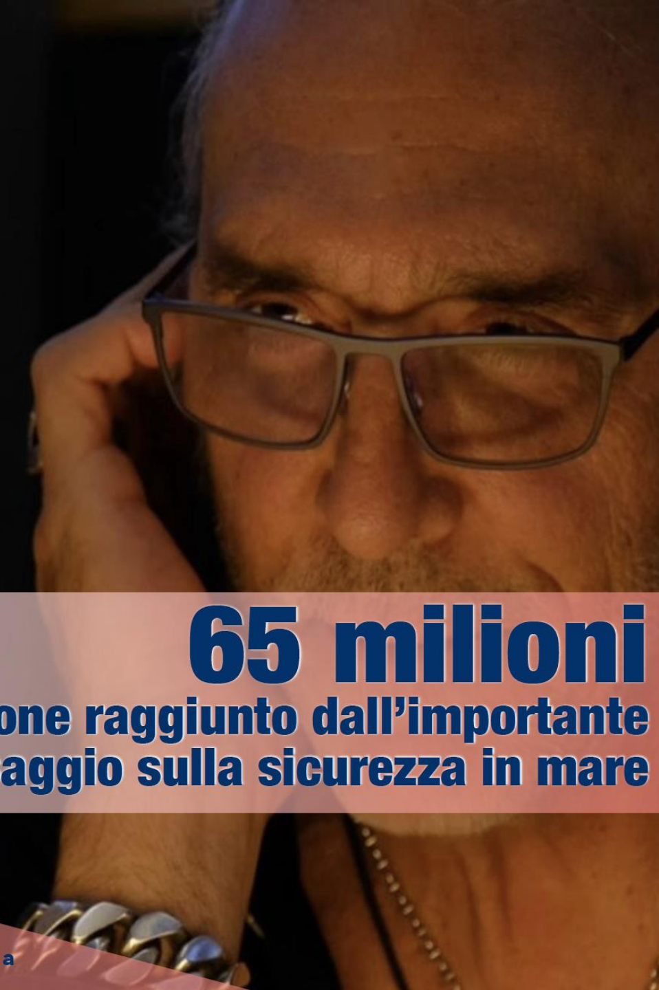
IMMAGINE E REPUTAZIONE, SINONIMO DI AFFIDABILITA' E FIDUCIA Nell'attuazione delle strategie di Vertice, l'impegno a rappresentare un riferimento concreto per il cittadino e la comunità internazionale

65 milioni Il numero di persone raggiunto dall'importante messaggio sulla sicurezza in mare